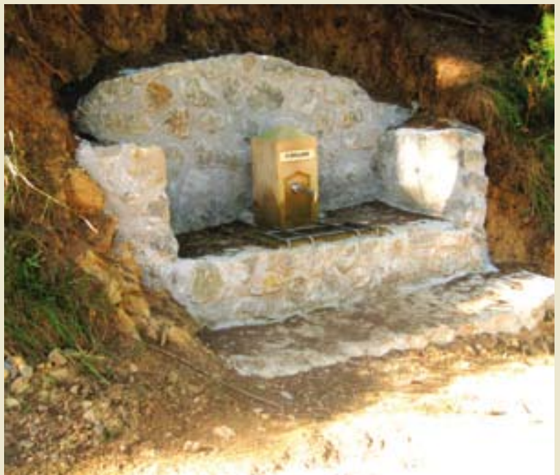
▲ Iturrihaundi iturri berria

Lekaiok udaletxean aurkeztu zuen proposamena eta Goimenek ere aurrekontuaren %55 eko diru-laguntza eskaini du. Zintzo Mintzo, Ostadar eta Goierri elkarteetara ere jo zuten laguntza eske eta lerro hauen bitartez eskerrak eman nahi dizkiete.