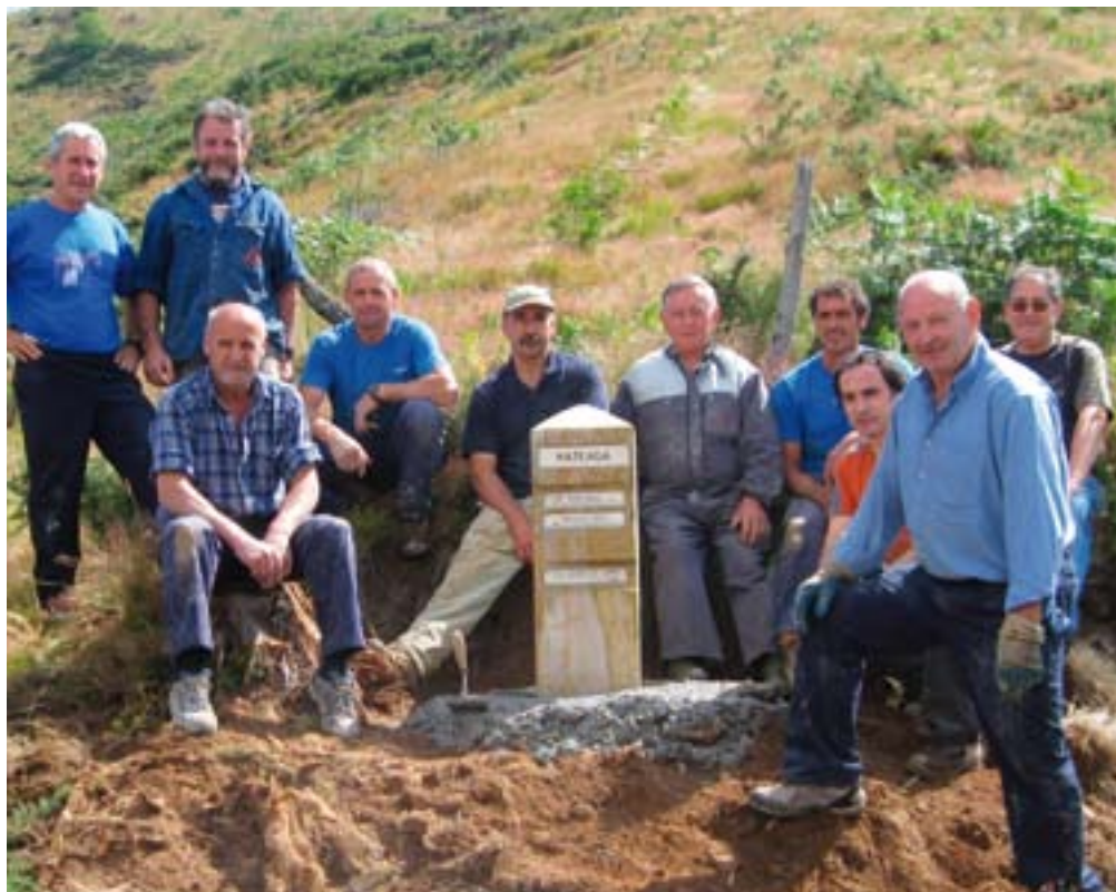
▲ Auzolanean aritutako taldekide batzuk

ra igo naiz “betiko bidetik” eta zein da bide hori?” diote. Alde horretatik, egitasmo honen helburua toponimia eta Irimon ibiltzeko beste bide batzuk badirela ezagutaraztea da herritarrok eta jendeak erabil ditzan.