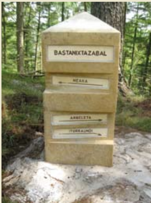
▲ Toponimia harrietako bat