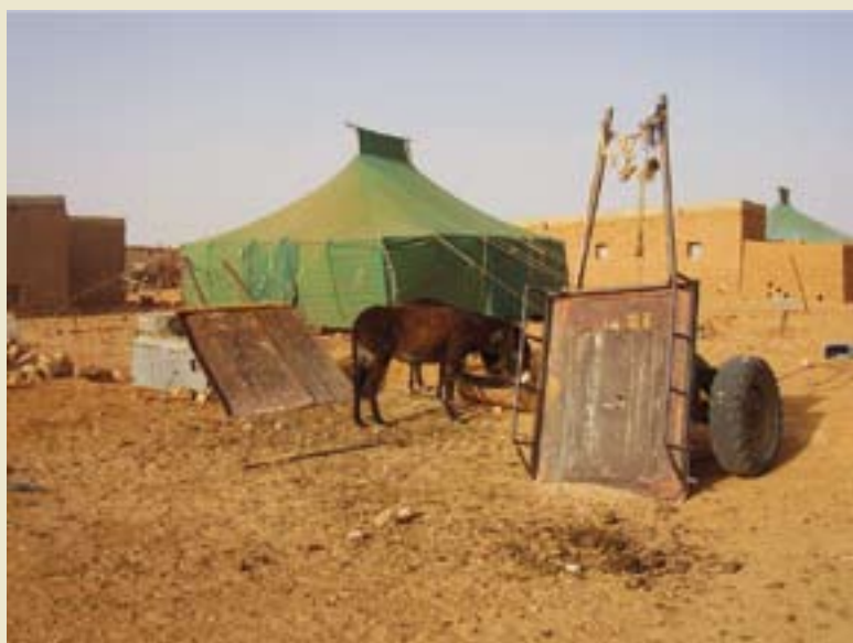
◀ Kanpamenduen "aberastasuna": Gurdiak, astoak, pezoako etxetxoak eta "jaimak".

que es caro y muy cansado, pues no paras en durante cinco días, porque todos te quieren conocer y agasajar, en el desierto y a 40°... volvería con los ojos cerrados. No lo cambiaría por unas vacaciones".