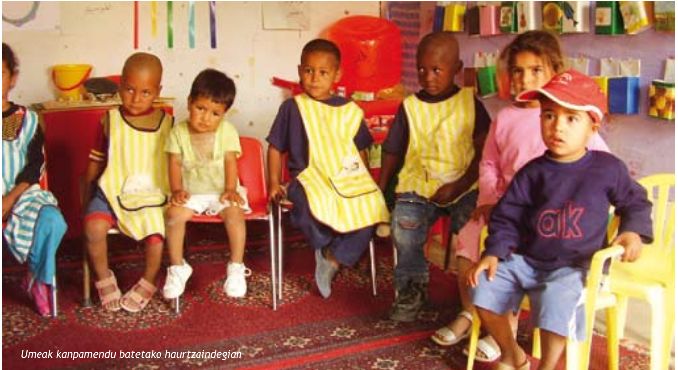
Umeak kanpamendu batetako hartzaindegian

Hoy les voy a contar una historia, o un par de ellas. He aquí la primera: