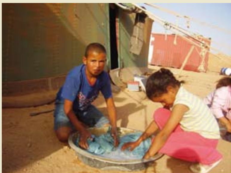
▶ Naza eta bere neba etxeko lanak egiten, arropa garbitzen, hain zuzen.