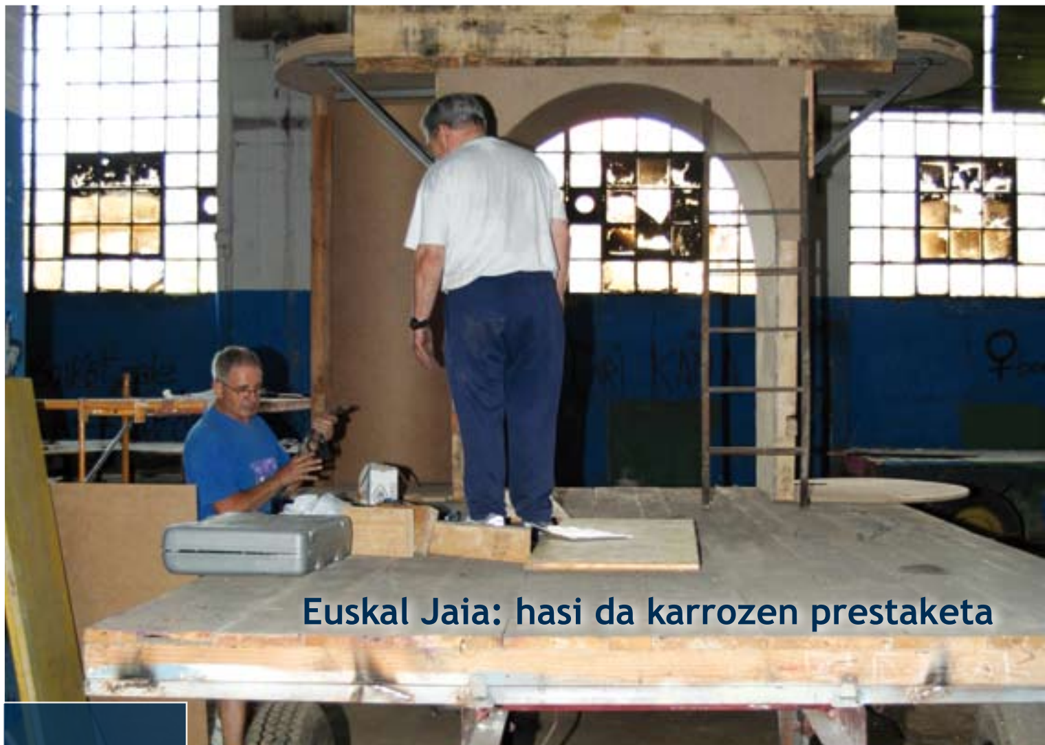
Euskal Jaia: hasi da karrozen prestaketa