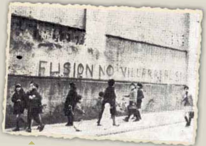
▲ Iñaki Linazasororen "Villarreal de Urretxua ayer y hoy" liburutik ateratako argazkia

Durante su paso por la Alcaldía se llevaron a cabo varias traídas de aguas y se impulsó la instalación de un horno crematorio en Legazpi para junto con Zumarraga prestar servicio a los tres municipios. También, dentro del ámbito mancomunal, y gracias al acuerdo conseguido con la familia Orbegozo, se logró poner en marcha el originario Instituto de Bachillerato situado en pleno centro de la villa.