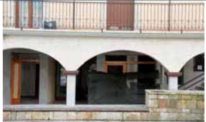
▲ Gazte Txokoa

Urretxuri zerbitzu hobea eta erosoagoa emateko, Udalak lan antolaketa berria du abian eta horretara egokituz hainbat obrari ekin dio. Udaletxearen egoitza, liburutegia eta gazteentzako instalakuntzak dira, besteak beste, egun Urretxun obrak dituzten eremuak.