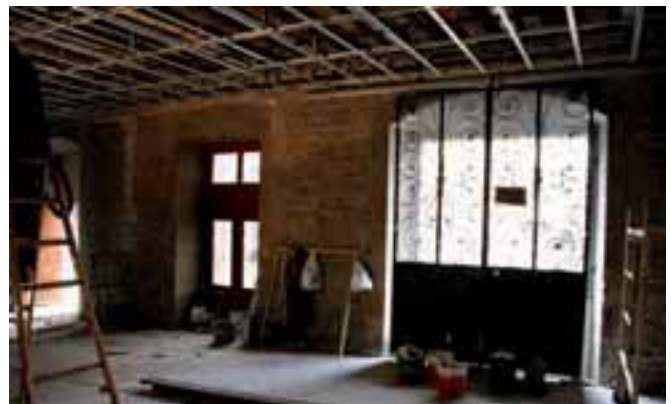
▲ Udaletxe sarrera

Kaixo 102. alea 2010eko ekainia Urretxuko Udal Aldizkaria