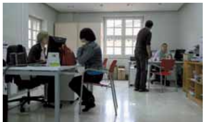
▲ Kulturako bulego berria

Si no vives en Urretxu y quieres recibir la revista KAIXO en tu buzón, déjanos tu dirección en el teléfono 943 03 80 88 o bien en kultura.ur@urretxu.net.