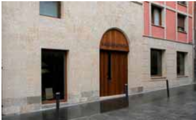
▲ Bake Epaitegia