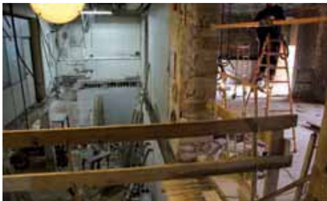
▲ Udaketxea barrutik