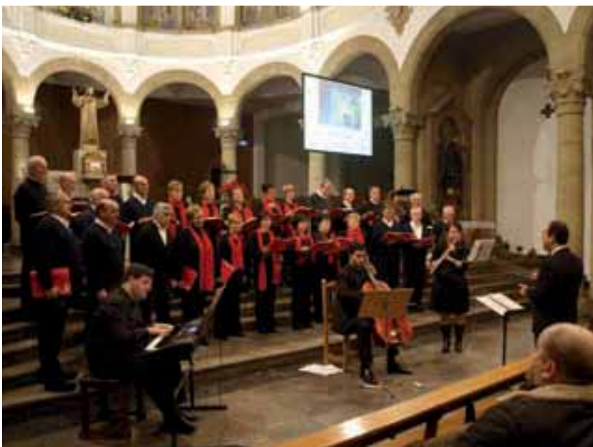
▲ Irimo-Azpi abesbatza gabonetako kontzertuan

No queremos dejar pasar esta ocasión sin agradecer la labor de todas las personas que de una u otra manera han formado parte de nuestro coro IRIMO AZPI.