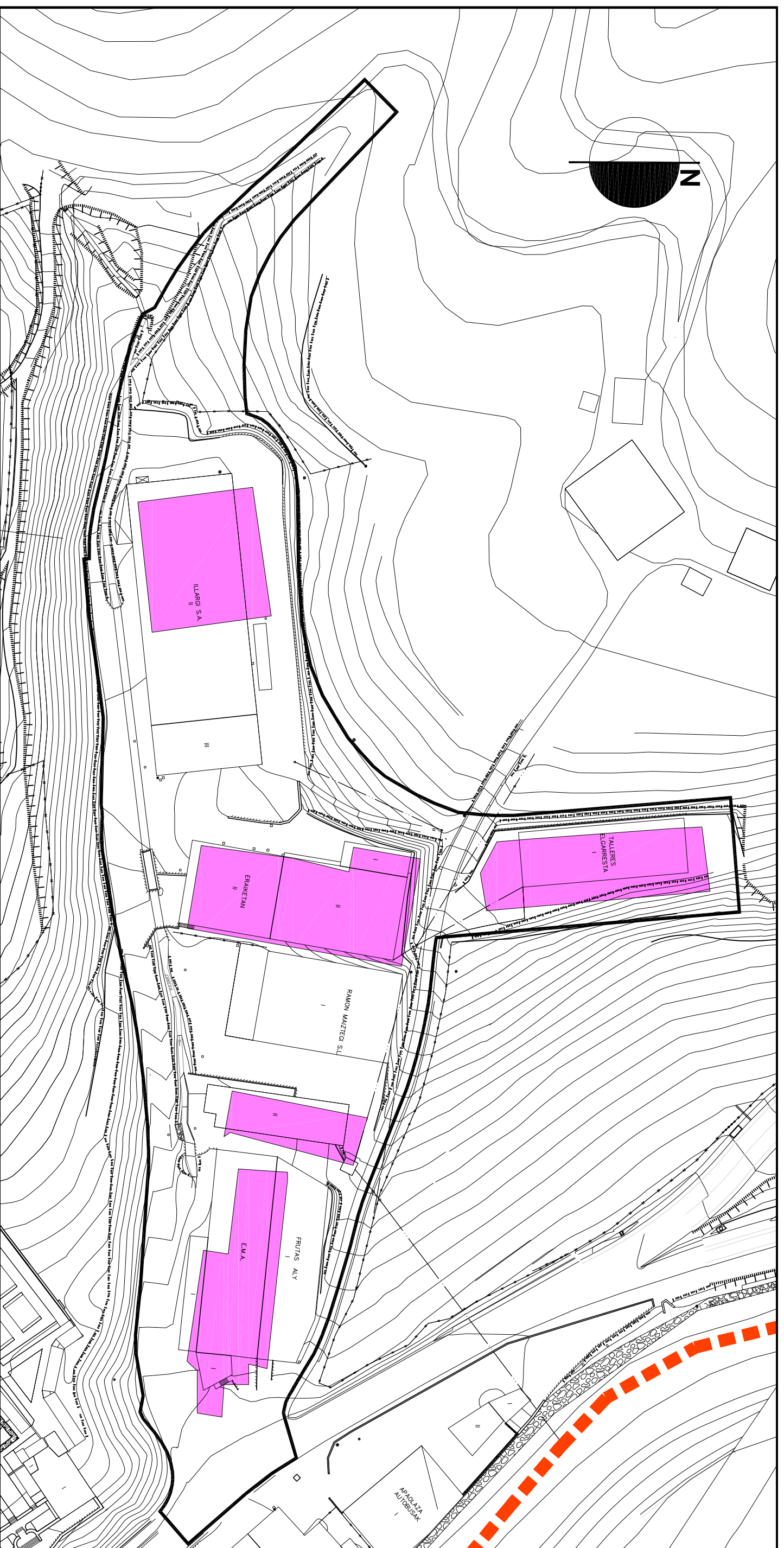
1. EGUINGO EGOERA Eskala 1/1000