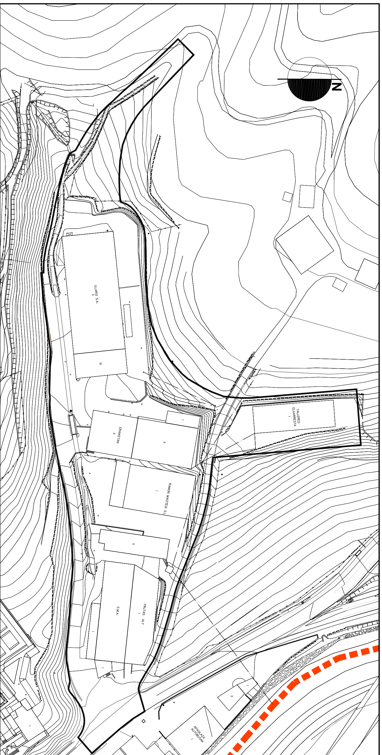
1. GAINJARRIA Eskala 1/1000