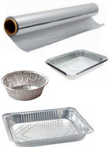
Aluminiozko bandejak. Aluminiozko papera Bandejas de aluminio. Papel de aluminio