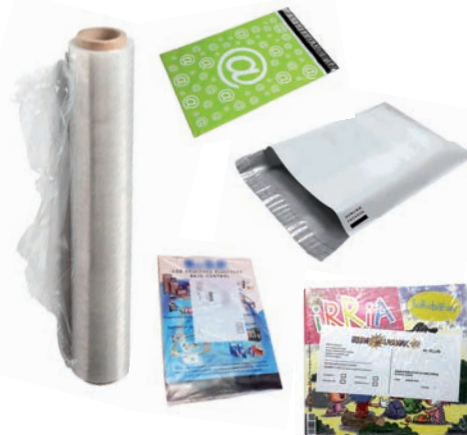
Plastiko filma. Mezularitzan eta propagandan erabilitako plastikozko bilgarriak Plástico film. Envoltorios de plástico utilizados en mensajería, propaganda, revistas...