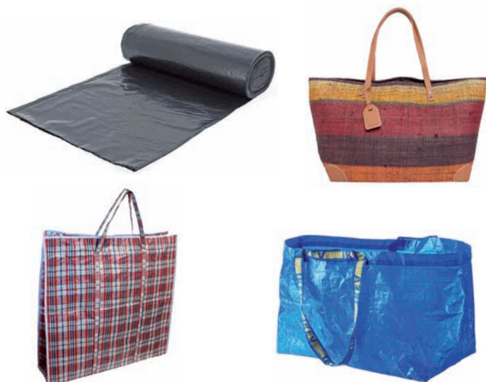
Zabor-poltsak, errafiazko poltsak Bolsas de basura, bolsas de rafia