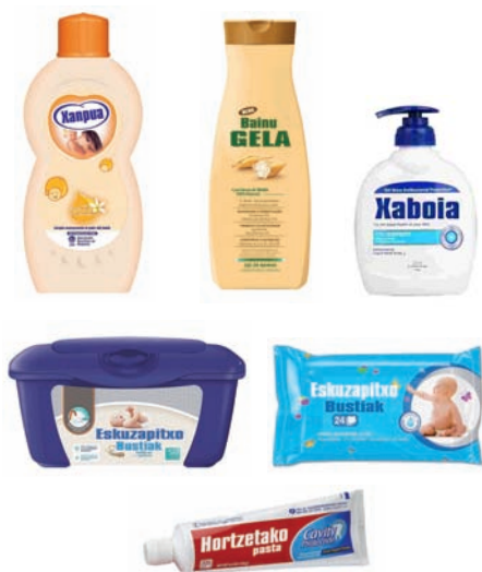
Higiene pertsonala: xanpu, gel, xaboi, hortzetako pasta... Higiene personal: gel, champú, jabón, pasta de dientes...