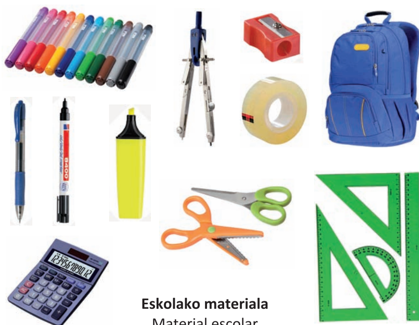
Eskolako materiala Material escolar