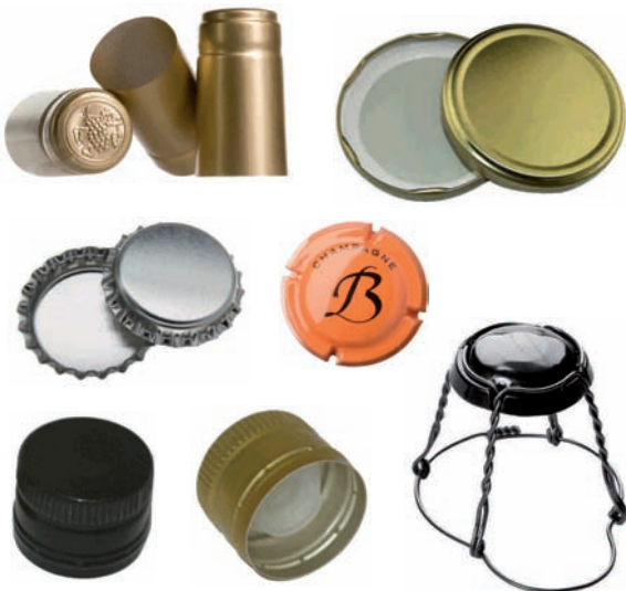
Tapa, kapsula eta sare metalikoak. Трапак Tapas, cápsulas y rejillas metálicas. Chapas