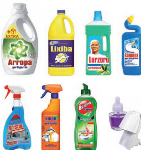
Garbigarrientzako ontziak. Entxufatzen diren giroitzaileak Envases de productos de limpieza. Ambientadores enchufables