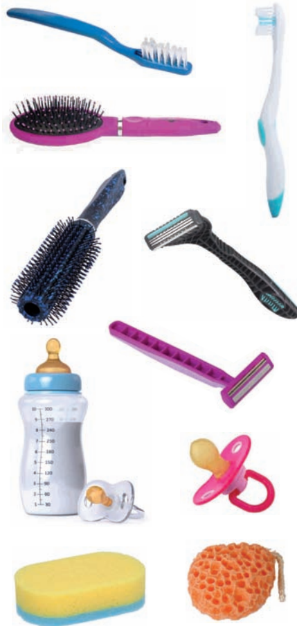
Hortzetako eskuila, ilearentzako eskuila, bizar-aitzurra, depilazio-aitzurra, biberioia, txupetea, esponja...