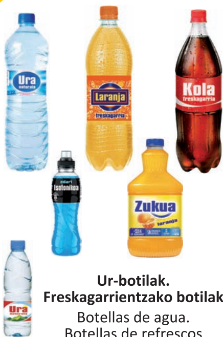
Ur-botilak. Freskagarrientzako botilak Botellas de agua. Botellas de refrescos

plastikozko ontziak ✓ envases de plástico