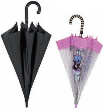
Pertxak, aterkiak.. Perchas, paraguas...