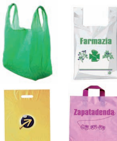
Komertzioetan emandako plastikozko poltsak Bolsas de plástico entregadas por comercios