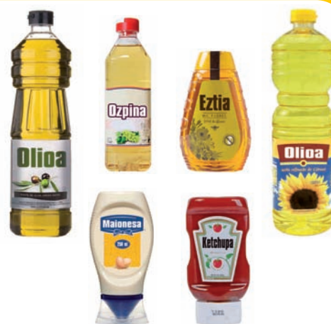
Olio, ozpin, eztiarentzako... plastikozko botilak Botellas de plástico para aceite, vinagre, miel...