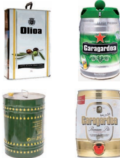
Bidoi edo garrafa metalikoak (olioa, garagardoa) Bidón o garrafa metálica (aceite, cerveza)