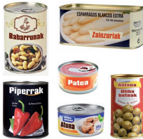
Kontserba-latak (olibak, atuna, zainzuriak, lekaleak...) Latas de conserva (aceitunas, atun, esparragos, legumbres...)