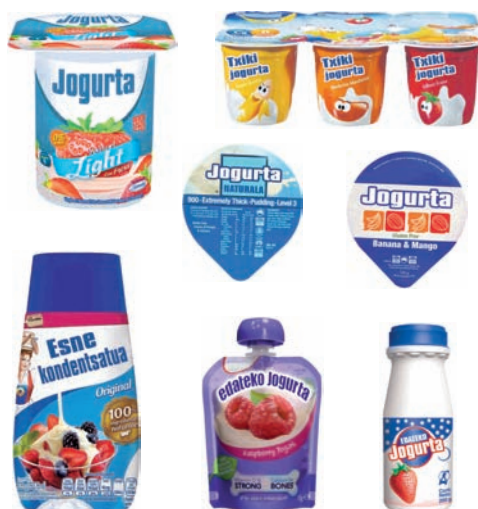
Yogurt-ontziak (tapa ere bai) eta esnekientzako ontziak Envases de yogurt (la tapa también) y de lácteos