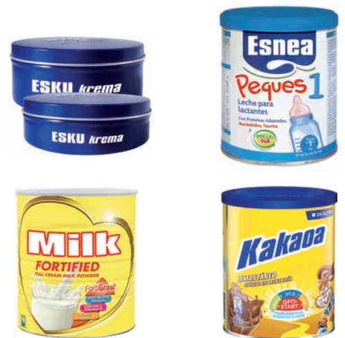
Beste pote metaliko batzuk (eskutarako krema, haurrentzako esnea...) Otros botes metálicos (crema de manos, leche infantil...)