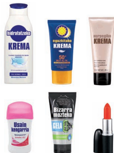
Zaintze pertsonalerako produktuen ontziak Envases de productos para el cuidado personal