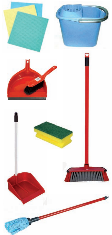
Erratza, zoru-garbigailua, zikinkeria jasotzeko pala, baieta, espartzua...