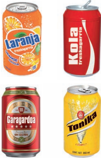
Garagardo eta freskagarrientzako latak Latas de cerveza y refrescos