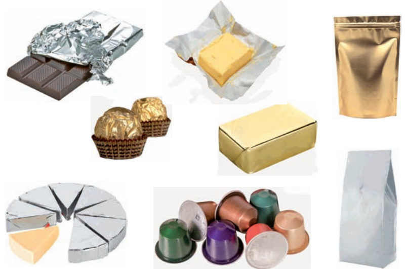
Aluminiozko bilgarriak. Kafearentzako kapsulak (hutsik!) Envoltorios de aluminio, Cápsulas de café (¡vacías!)