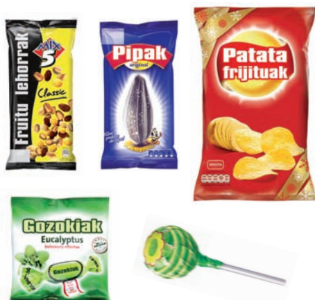
Litxarkerientzako poltsak. Txupatxusen makiltxoak eta bilgarria Bolsas de chuches. Palito y envoltorio del chupa chus