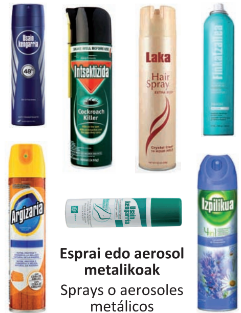
Esprai edo aerosol metalikoak Sprays o aerosoles metálicos