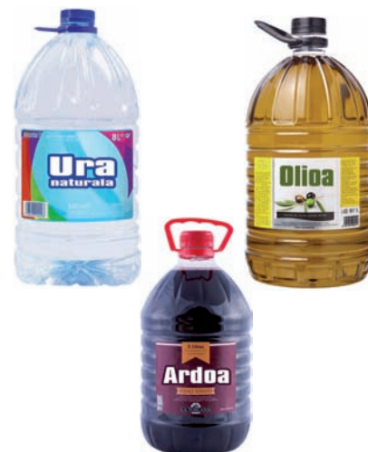
Garrafak eta bidoiak: ura, olioa, ardoa... Garrafas y bidones: agua, aceite, vino...