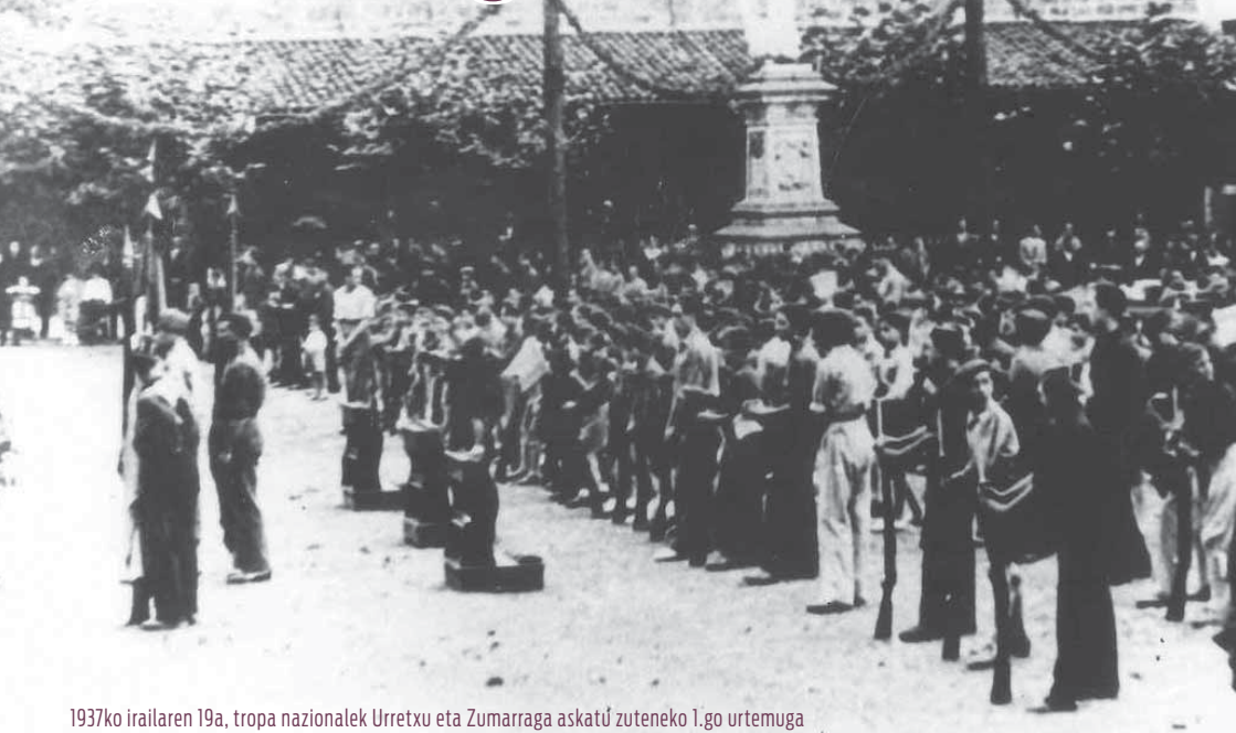
1937ko irailaren 19a, tropa nazionalak Urretxu eta Zumarraga askatu zuteneko 1.º urtemuga

Memorian Atzera taldeak irabazi du Urretxu eta Zumarragako udalek, memoria historikoa berreskuratzekeo prozesuetan konpromisoa harturik, egindako ikerketa bekarako deialdia. Lan honen helburua 1936. urteko altxamendu militarrek, Guda Zibilak eta frankismoak Urretxun eta Zumarragan izandako eragina ikertzea izango da.