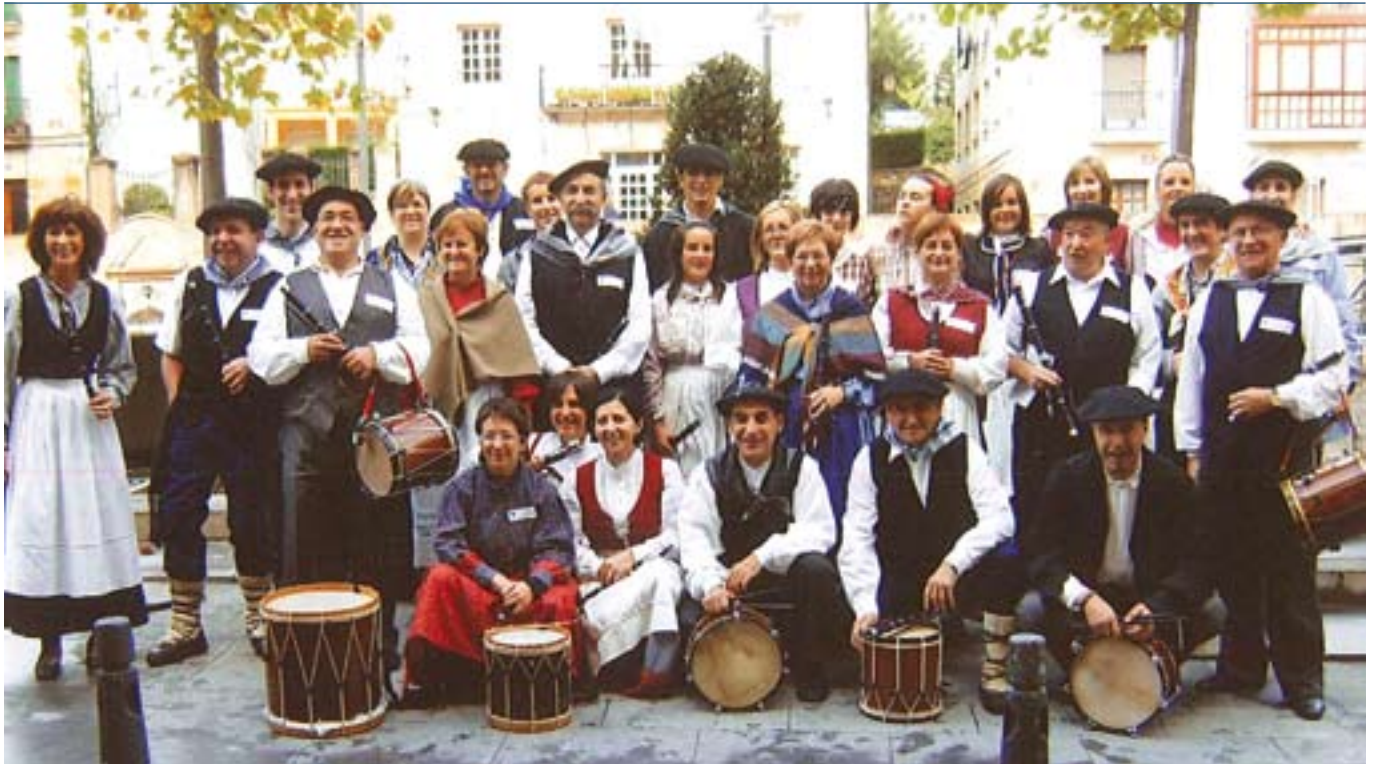
▲ Urretxuko Txistulari Taldea 2009ko Euskal Jai egunean.

Urretxuko txistulari taldea sortu zela 50 urte beteko dira aurten. 1959ko Euskal Jaiak emandako bultzadaren ondorioz hasi ziren txistulariak elkartzen, eta urtebete beranduago, 1960ko Euskal Jai egunean, egin zuten euren jendaurreko estraineko agerraldia. Urteurren seinalatua merezi bezala ospatzeko, hainbat hitzordu berezi izango dira urtearen joanean.