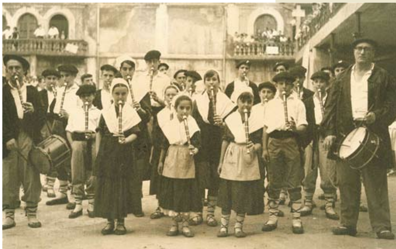
▲ Urretxuko Txistulari Taldea 1964ko Euskal Jai egunean.

abestiak bilduko dituen diska kaleratzea. Ospakizun nagusia, bestalde, irailean egingo da, irailaren 12an, festen aurreko asteko igandean. Helburua taldekide izandako ahalik eta lagun gehien elkartzea izango da. Horrez gain, taldearen historia jasotzen duen liburua eta DVDa aurkeztuko dira irailean, eta hitzaldiren bat ere egingo da.