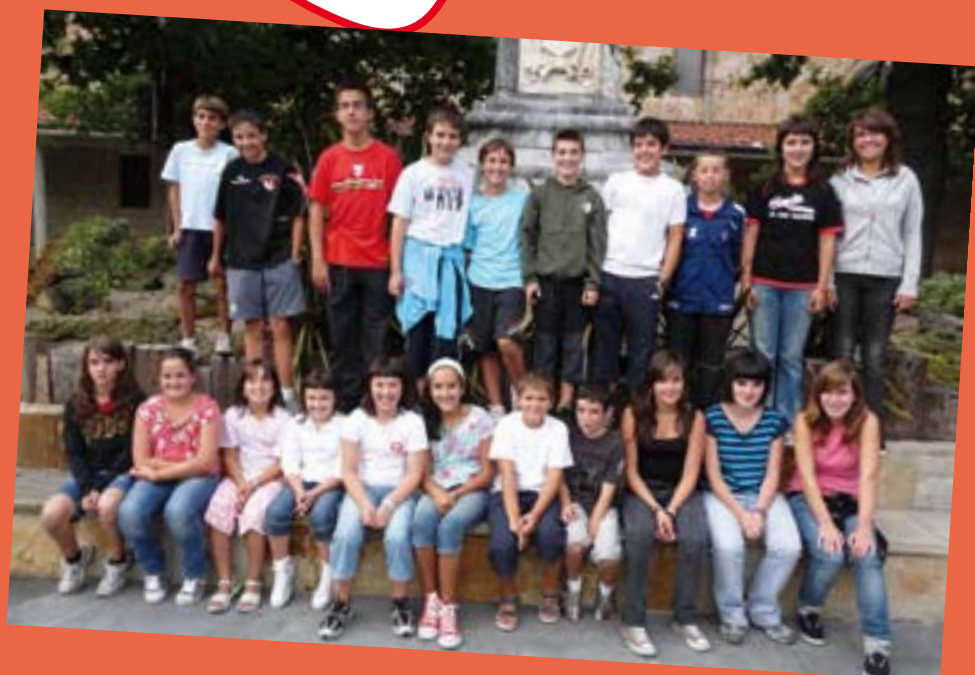
Bertso eskolako kideak