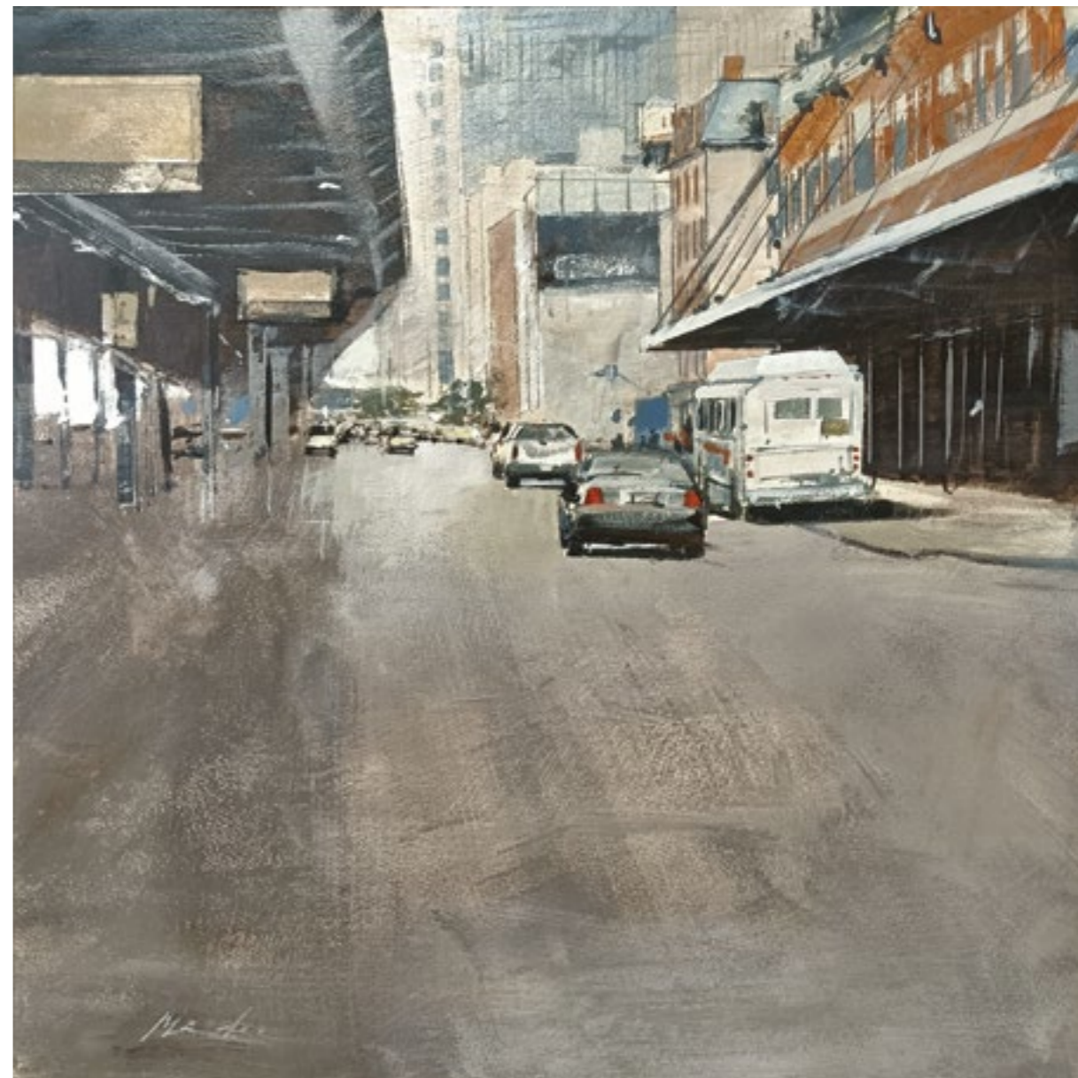
Mercado del Pescado. 60x60 cm. Acrílico sobre papel.