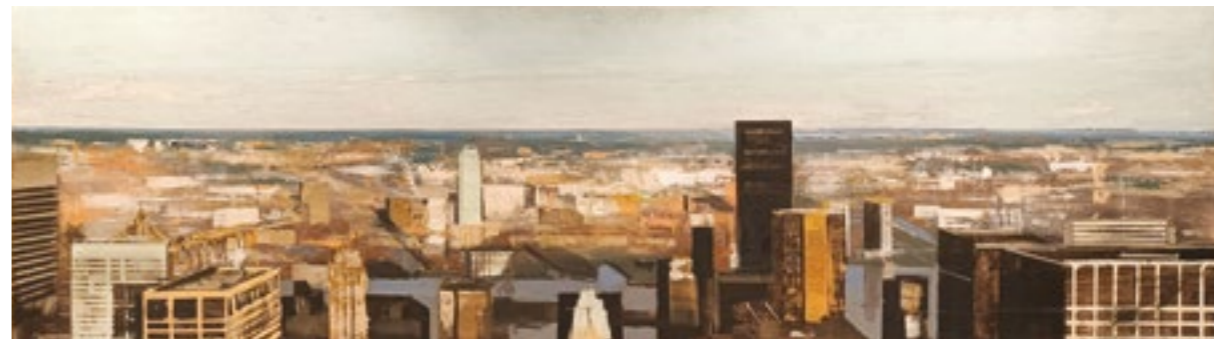
Empire. 146x30 cm. Óleo sobre tabla.