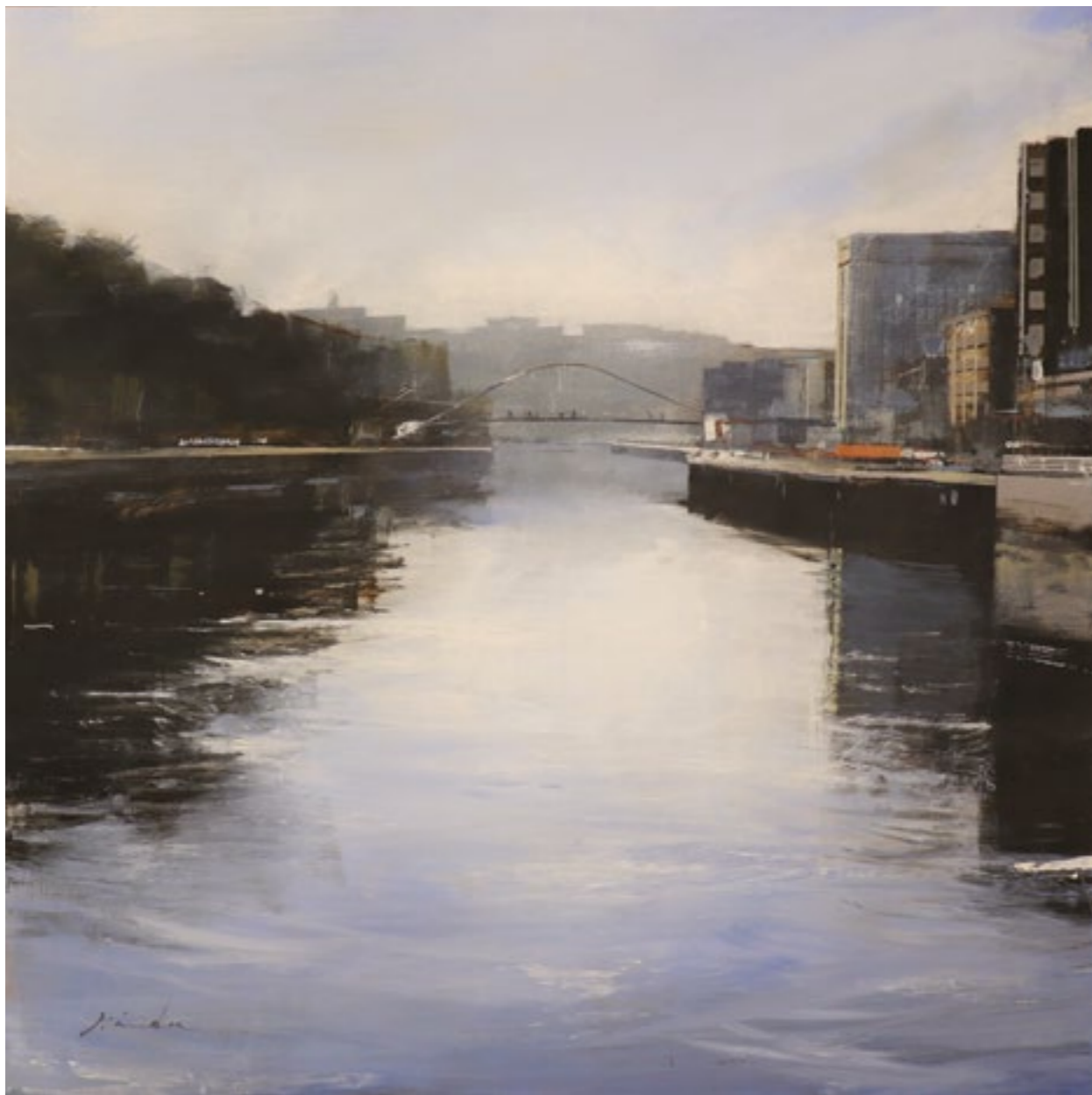
Zubizuri. 122x122 cm. Acrílico sobre tabla.