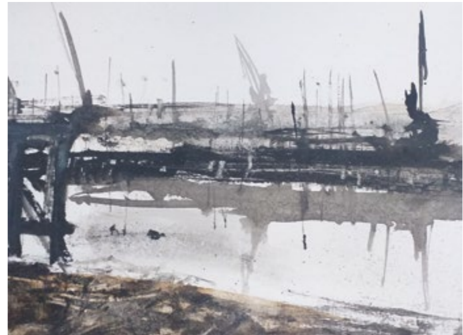
Dársena. 37x24 cm. Nitram sobre papel.