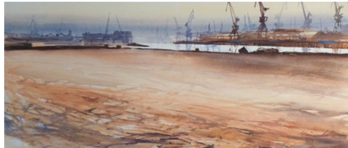
Axpe. 122x60 cm. Acuarela sobre papel.