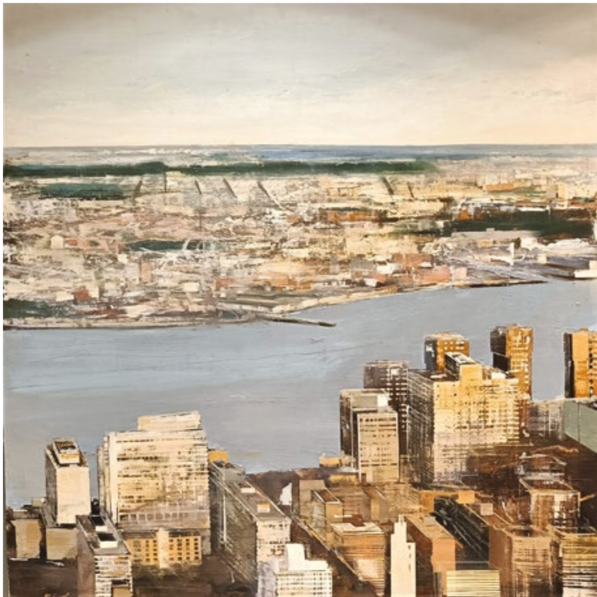
Hudson River. 116x116 cm. Óleo sobre tabla.