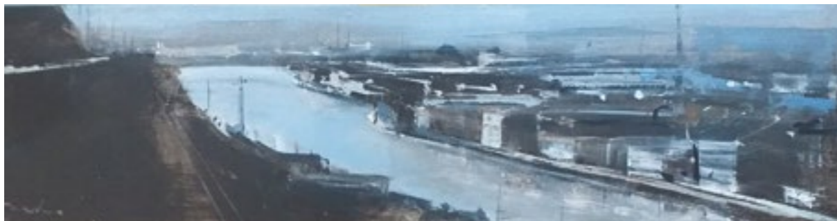
Zorroza. 75x19 cm. Acrílico sobre tabla.