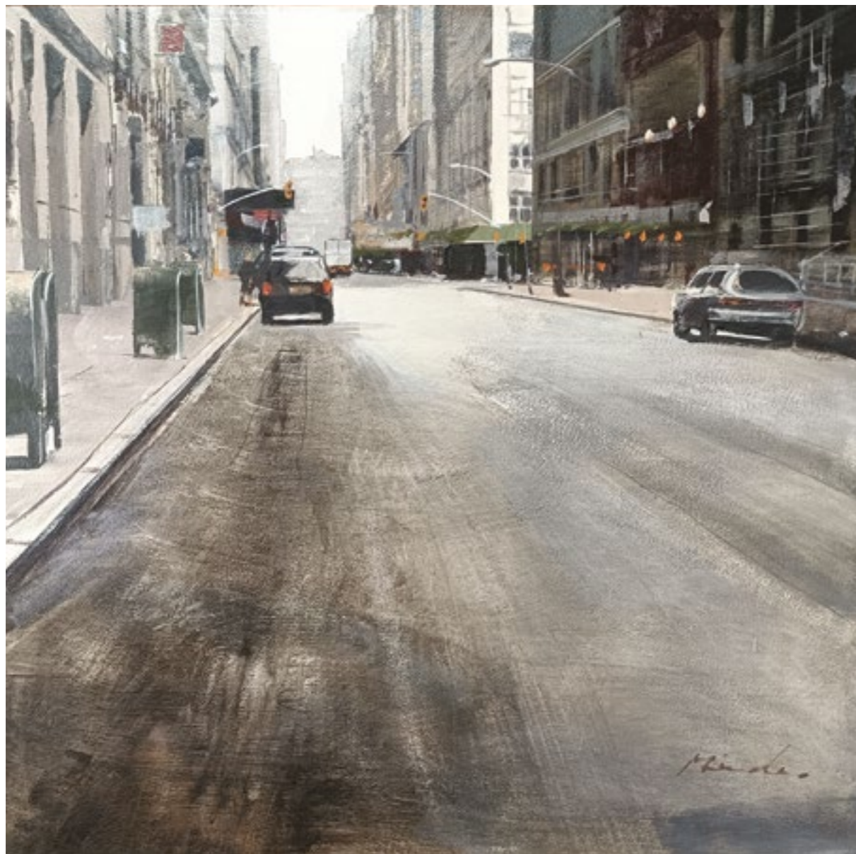
47 Street. 60x60 cm. Acrílico sobre papel.