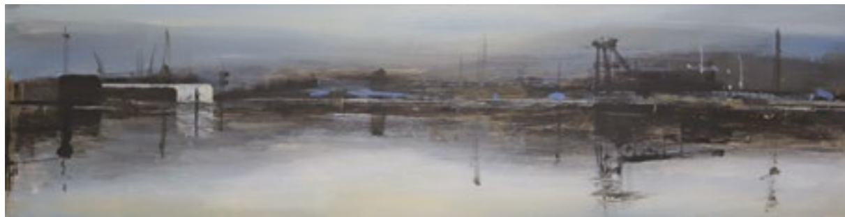
Ría. 75x19 cm. Acrílico sobre tabla.