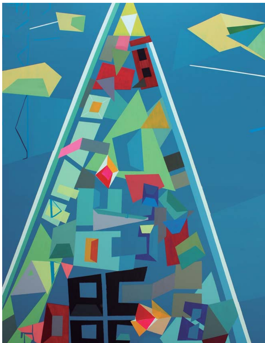
Mixta sobre tela. 145 x 114 cm.