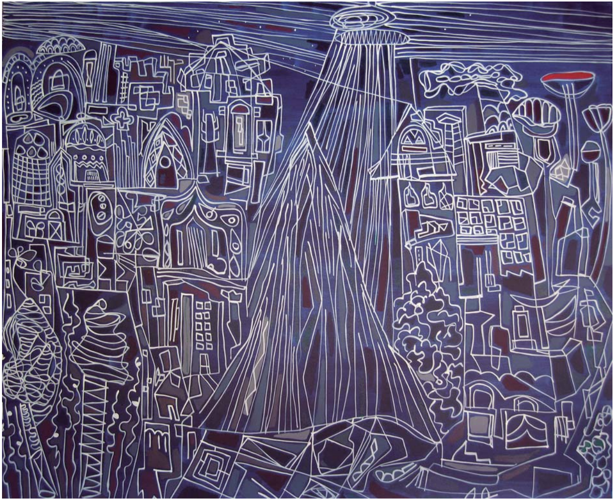
Mixta sobre tela. 130 x 162 cm.