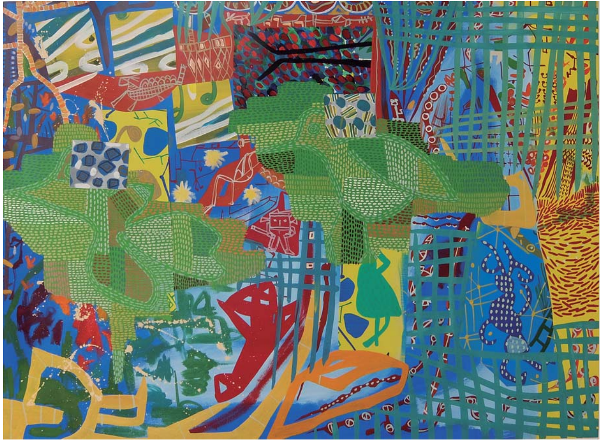
Mixta sobre tela. 97 x 130 cm.