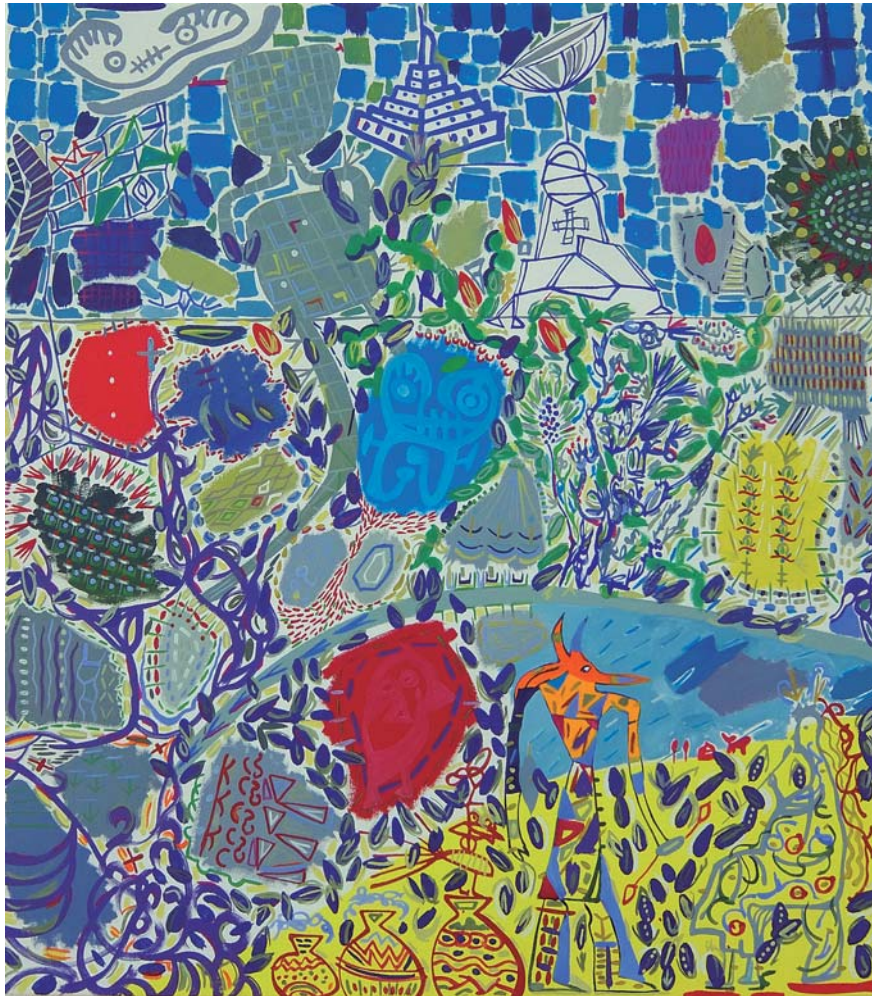
Mixta sobre tela. 80 x 71 cm.