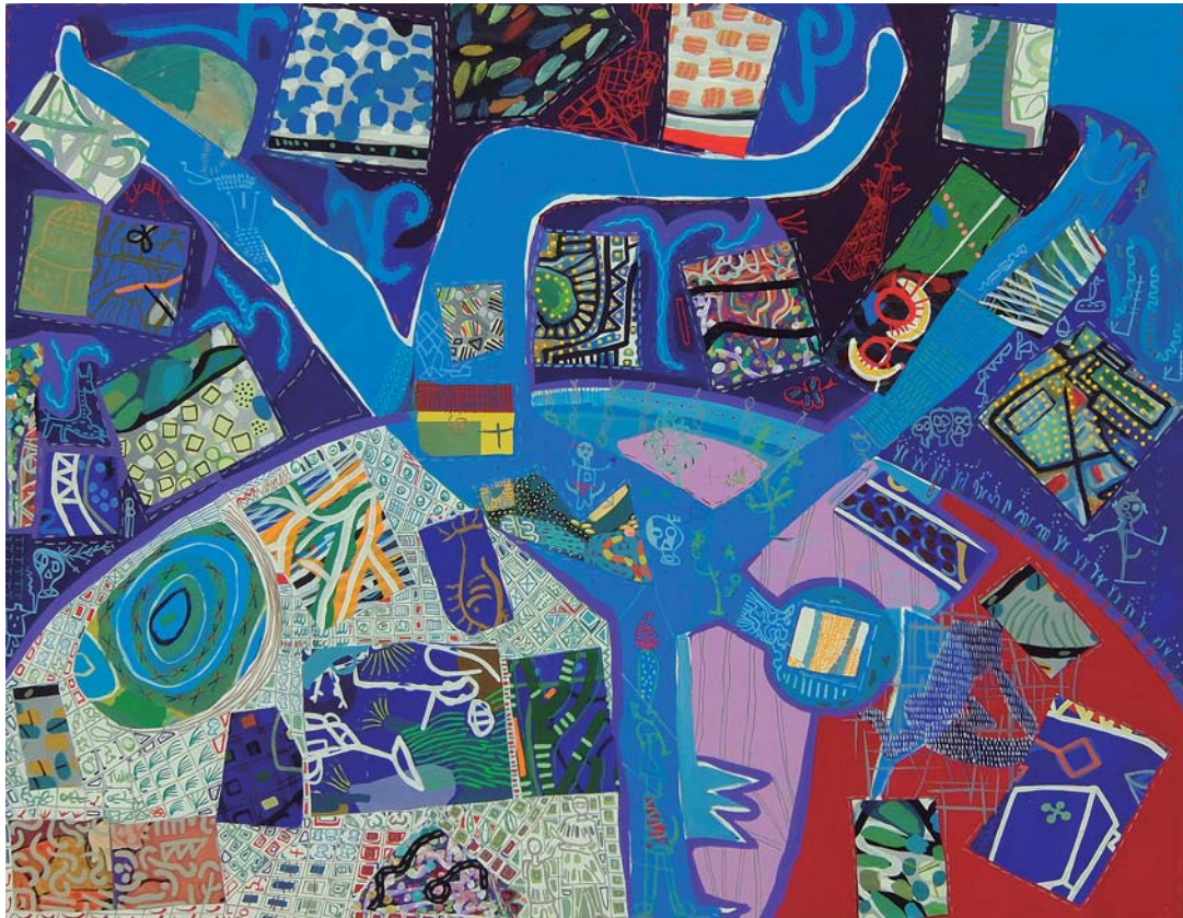
Mixta sobre tela. 130 x 162 cm.