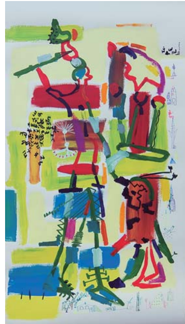
Mixta sobre papel pintado.