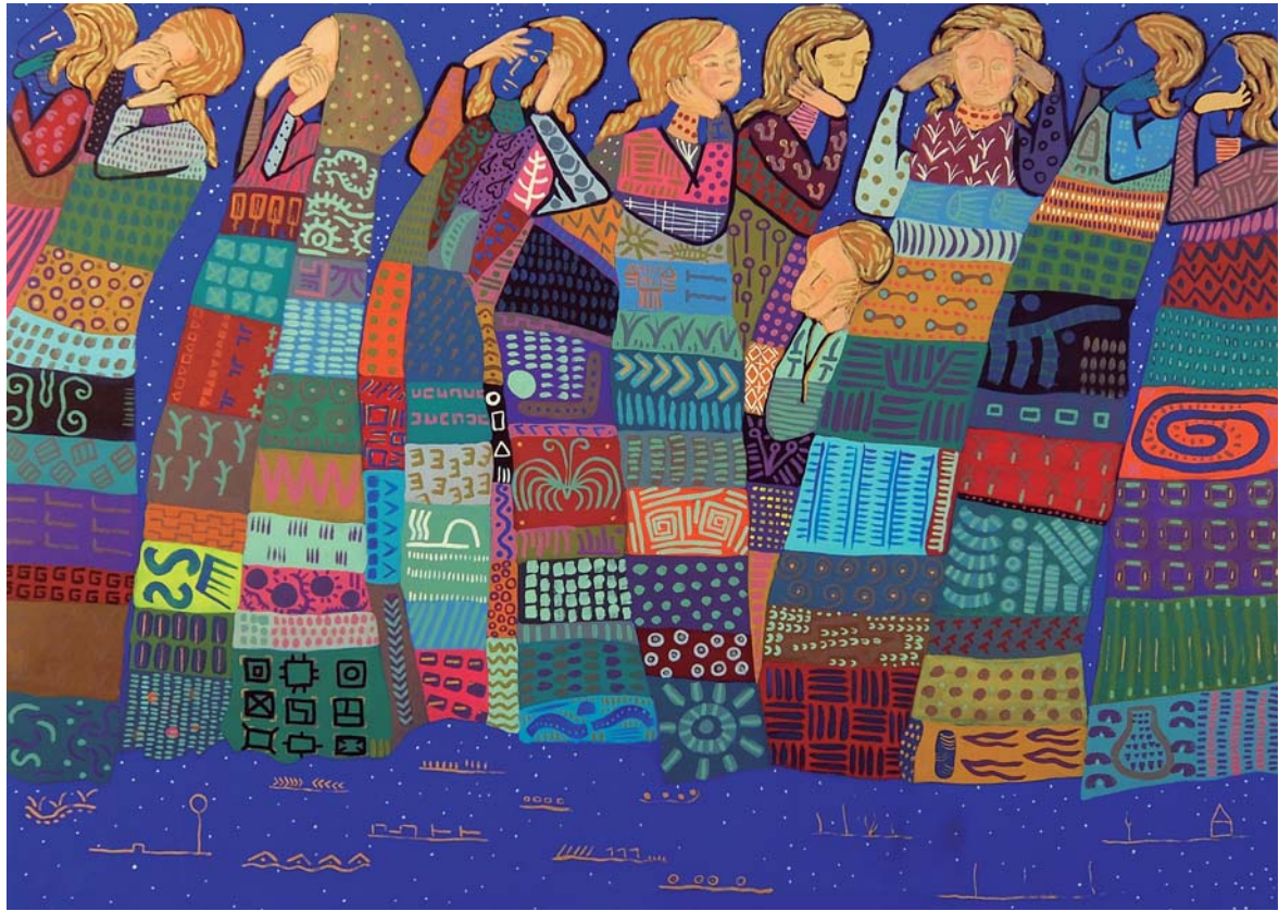
Mixta sobre tela. 97 x 130 cm.