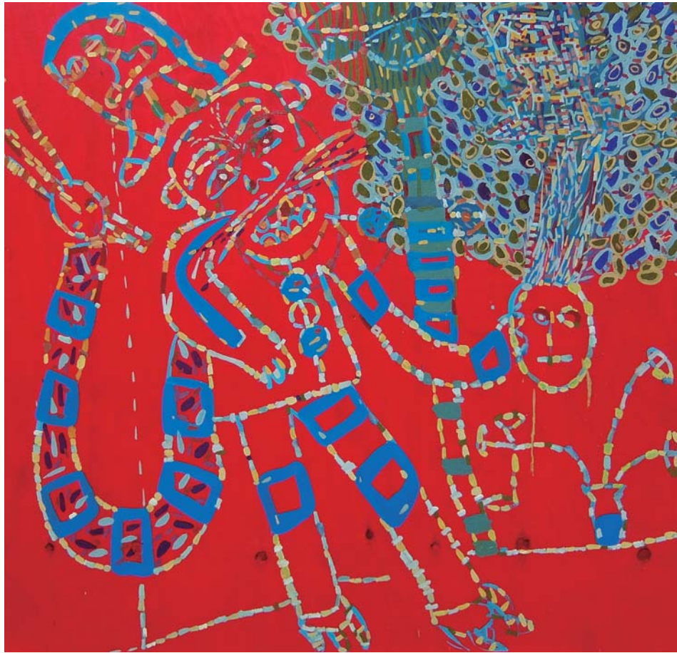
Mixta sobre tela. 106 x 106 cm.