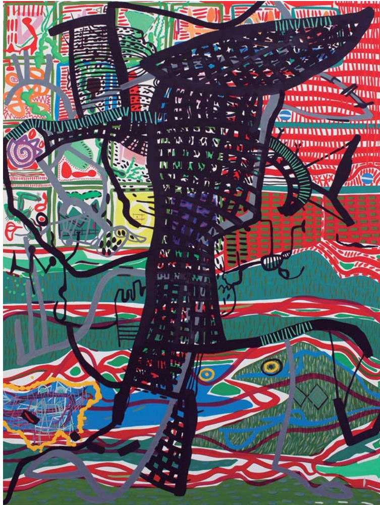
Mixta sobre tela. 130 x 97 cm.